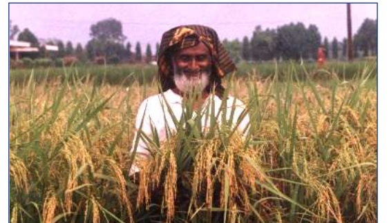
আমি এখন ভাল বীজের মালিক