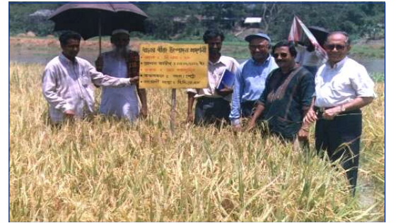
ভিত্তি বীজ উৎপাদন কার্যক্রম পরিদর্শন

সরকারি, বেসরকারি ও ব্যক্তি উদ্যোক্তাদের মধ্যে সমন্বয়, বীজের আদান প্রদান, সম্পদের সুস্থ ব্যবহার এবং অংশীদারিত্বের মাধ্যমে বাস্তবায়ন করা যায়। এই ধান বীজ নেটওয়ার্ক জাতীয় পর্যায়ে ছাড়াও আঞ্চলিক পর্যায়ে বাস্তবায়িত হচ্ছে। এযাবৎ ৫০০টির বেশি প্রতিষ্ঠান এ নেটওয়ার্কের সাথে জড়িত হয়েছে। ব্রি এই নেটওয়ার্কের নেতৃত্ব দেয়। বিএডিসি ছাড়াও জাতীয় পর্যায়ের বেসরকারি প্রতিষ্ঠান/কোম্পানির নিকট থেকে ছোট প্রতিষ্ঠানগুলো উল্লিখিত সুবিধাসমূহ নিতে পারে।